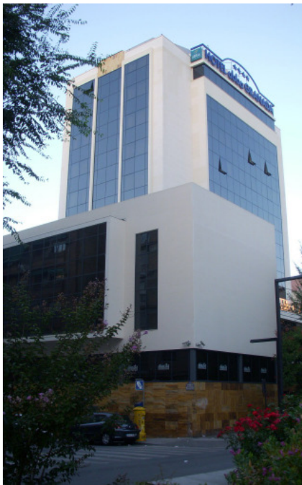
EDIFICIO DE LOS ANTIGUOS SINDICATOS HOY RECONVERTIDO EN HOTEL DE CUATRO ESTRELLAS, EN LA AVDA. DE LA CONSTITUCIÓN