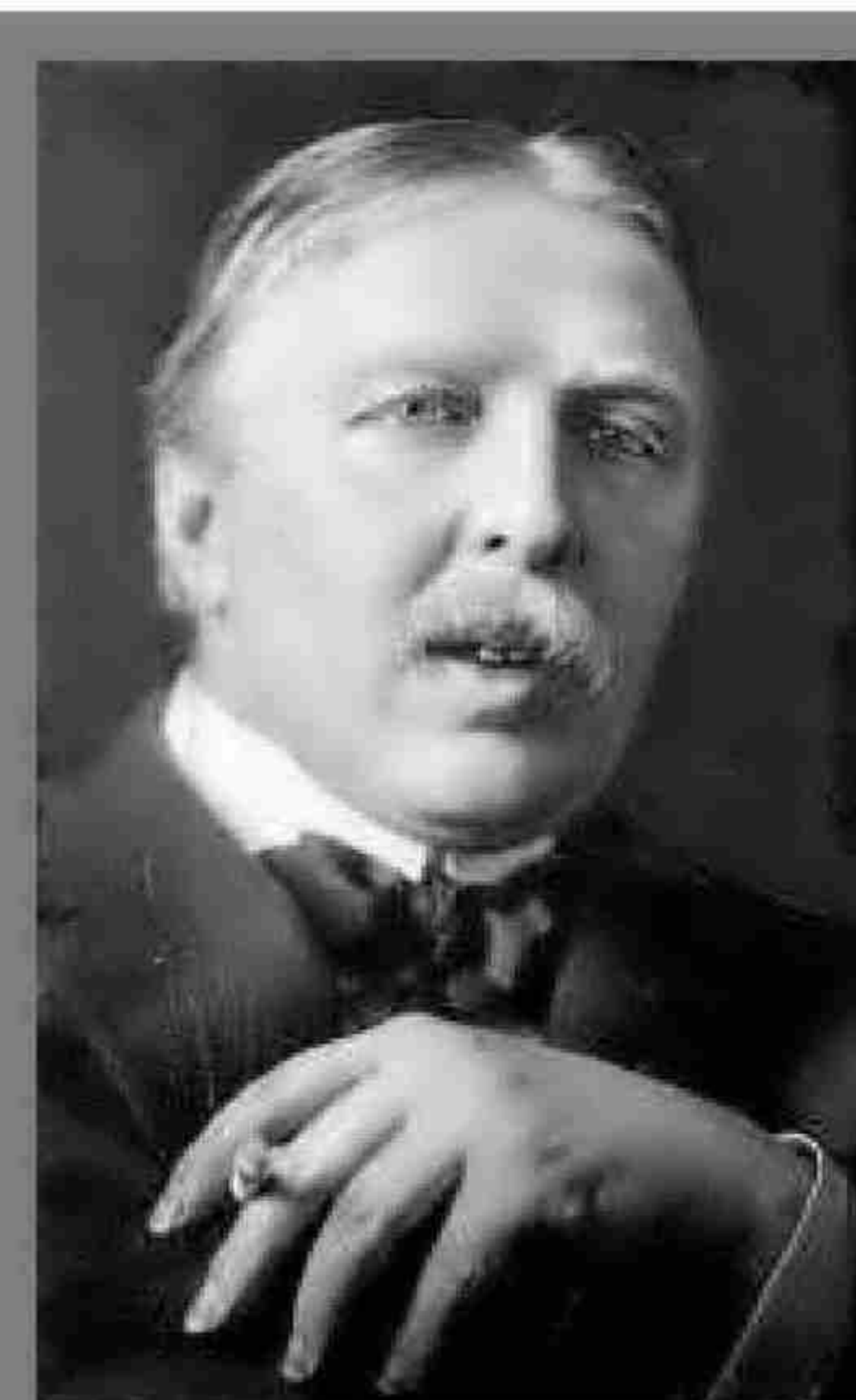
Grandes maestros. Los americanos Francis Scott Fitzgerald y Mark Twain son recordados a través de dos de sus textos más celebrados, ‘El gran Gatsby’ y ‘Las aventuras de Huckleberry Finn’. Del inglés Ford Madox Ford reaparece ‘El buen soldado’, novela sobre la pasión y el vacío.